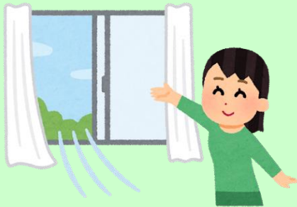
事業所の定期換気