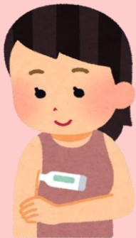
通所前検温のお願い