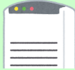
空気清浄機の設置