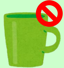
コップ等の共用禁止