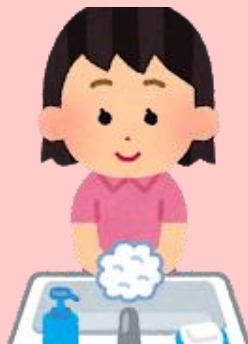
手洗い・消毒の実施