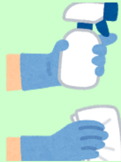
マシン・手すり等の消毒